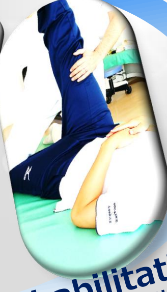
Rehabilitation (リハビリ特化型デイサービス)