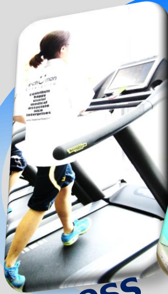
Fitness (フィットネスクラブ)